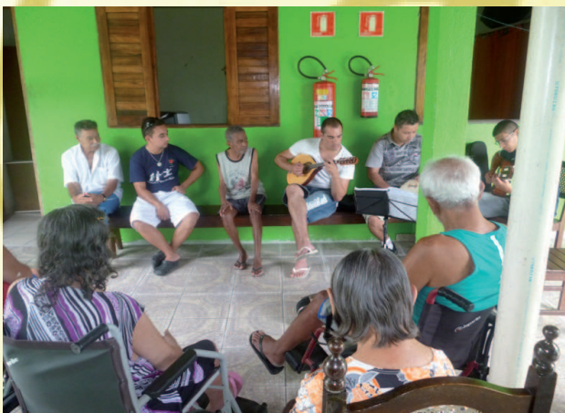
Grupo de Chorinho fez a alegria dos idosos da Casa do Idoso