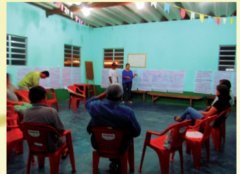
Reunião da Campanha

A Associação Rede Cananéia e a Colônia de Pescadores Z-9 “Apolinário de Araújo” realizaram a segunda reunião da Campanha de Consumo Consciente do Pescado proveniente da Pesca Artesanal, no último dia 13 de maio, segunda-feira, no Salão da Colônia, contando com a participação de pescadores artesanais, representantes da Colônia de Pescadores Z-9 “Apolinário de Araújo” e membros da Associação Rede Cananéia, com o objetivo de criar uma agenda de atividades para a Campanha, fortalecer propostas e o próprio grupo, que vem se reunindo com esta finalidade de realizar tal ação.