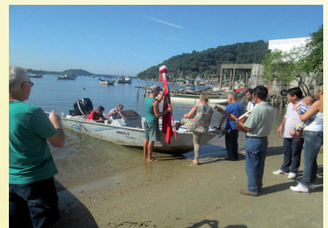
Saída da Bandeira

No dia três de maio, como é tradição aqui na Paróquia São João Batista de Cananéia, saiu mais uma Bandeira do Divino, rumo às comunidades caiçaras.