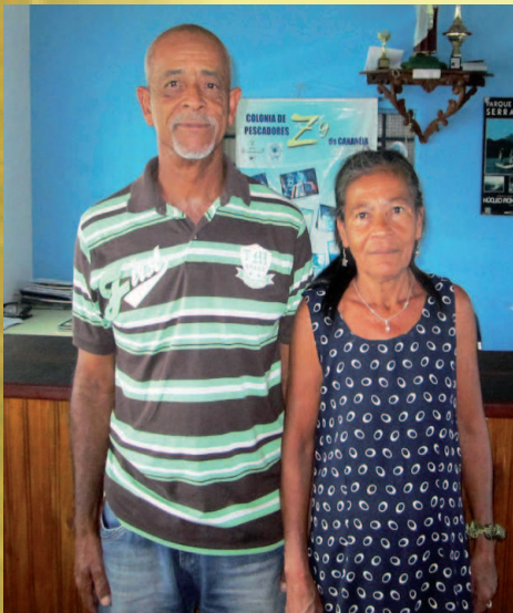
Casal de pescadores aposentado

A Colônia de Pescadores Z-9 “Apolinário de Araújo” vem aprimorando seus conhecimentos principalmente com o INSS – Instituto Nacional de Seguridade Social, para que cada vez mais os pescadores e as pescadoras tenham seus direitos garantidos.