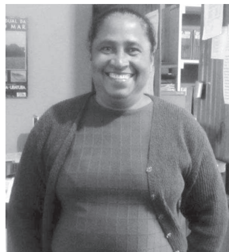
Pescadora do Mandira