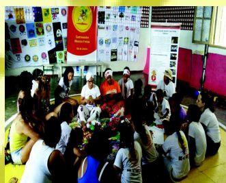
Oficina no Vidigal/RJ