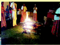
Roda de Jongo

Depois de um longo período de “férias”, o Jongo da Associação Grupo Cultural Tiduca voltou com toda a energia. Aconteceu no dia 27 de fevereiro, a 1ª