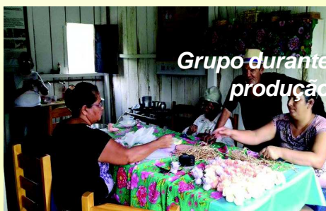
Grupo durante produção

O Grupo Cheiro do Mato – Produtos Naturais com Plantas Medicinais do Itapitangui se reuniu para produção de venda em atacado de trouxinhas perfumadas para o PEF – Programa Escola da Família da Escola Estadual “Professora Yolanda Araújo Silva Paiva” para a ação do Dia Internacional da Mulher e para produção da primeira remessa de brindes