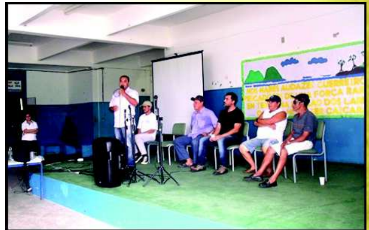
Roda de conversa sobre cultura caiçara

No dia 15 de março, terça-feira, na Escola Estadual “Professora Yolanda Araújo Silva Paiva” aconteceu o evento em homenagem ao Dia do Caiçara, instituído pela Lei Municipal N°. 1878/2007.