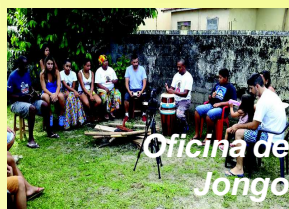
Oficina de Jongo