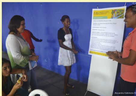
Jovens apresentaram proposta sobre manguezais

A comunidade da Enseada da Baleia foi um dos projetos selecionados, onde será feito uma conscientização ambiental com criação de uma linha de produto criados a partir de materiais de pesca descartados.