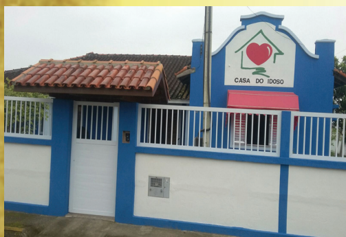
Nova fachada da Casa do Idoso

da por tempo indeterminado, sem fins lucrativos, de caráter organizacional, filantrópico e assistencial, com o objetivo de amparar as pessoas idosas de ambos os sexos, em regime de internato, semi-internato, sem distinção de raça, condições sociais, credo e ou convicções políticas, ideológicas ou filosóficas. Para tanto, entre outras ações, se propõe a: motivar a comunidade a melhor conhecer a causa dos idosos e cooperar com entidades interessadas na sua defesa; proceder convênios com órgãos públicos federais, estaduais e municipais, bem como solicitar e receber auxílios de órgãos públicos ou privados, promover e/ou estimular a realização de programas permanentes de prevenção e controle da saúde, promover entendimentos com todos os setores de atividades, contribuindo para criação de oportunidades adequadas de lazer permanentes e sem qualquer discriminação de clientela. Os recursos para a realização dessas ações são oriundos da contribuição de sócios, que normalmente, doam quantias a partir de R$ 5,00 mensais além de benefícios providos das esferas governamentais, doações esporádicas. Além disso, a diretoria da entidade realiza ações benéficas como bailes, jantares, bingos, even-