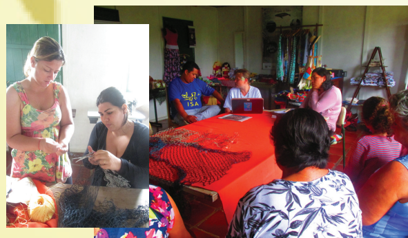
Confecção de novas peças

O Grupo é composto por nove mulheres que dividem a mão-de-obra trabalhando com autogestão, desenvolvendo a comunidade e gerando renda para as mulheres.