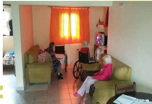
Maior qualidade de vida para os moradores

A SAVC presta serviço e executa projetos na esfera da proteção social de alta complexidade dirigido a idosos de ambos os sexos que se encontram em situações de vulnerabilidade ou risco social e pessoal. O projeto é destinado às pessoas com mais de 60 anos ou, como já ocorreram situações de casos emergências, onde se acolhem usuários com idades mais baixas, oferecendo acolhimento