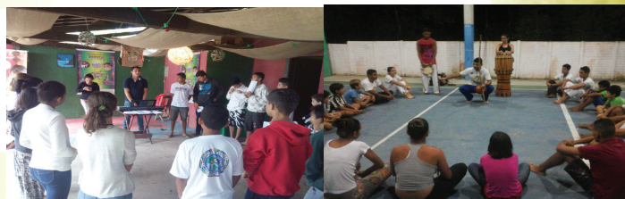
Oficina de Canto Coral e Roda de Capoeira

Na última semana o Grupo participou, ainda, da Oficina de Técnicas de Canto no Hostel Casa Verde em Cananéia e Oficina de Capoeira na Ilha Comprida.