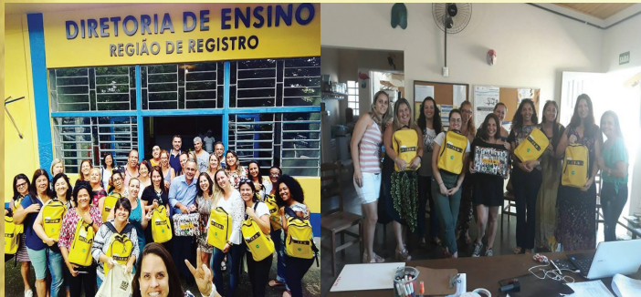
Entrega das Maletas na DER REG