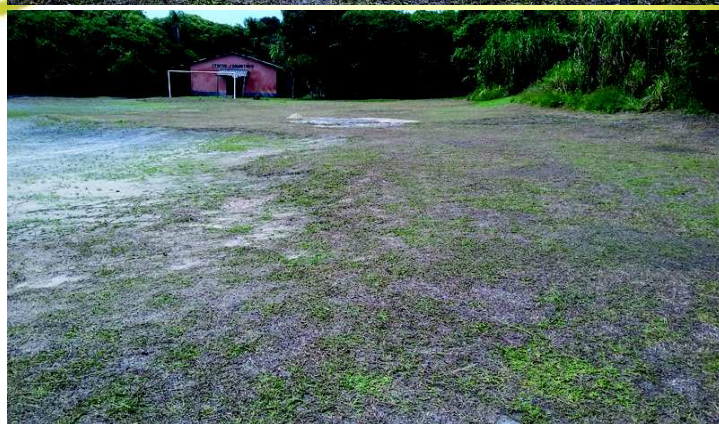
Melhorias no Campo de Futebol