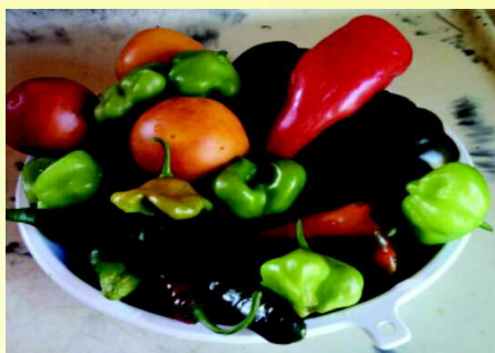
Alimentos saudáveis pela Enseada

Associação de Moradores da Enseada da Baleia-AMEB