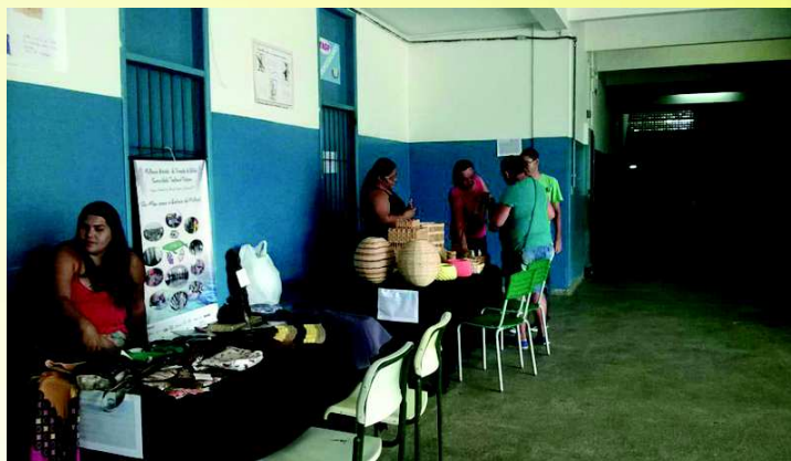
Exposição de empreendimentos solidários

O último dia dez de março foi de muitas atividades direcionadas às mulheres, o PEF – Programa Escola da Família da Escola Estadual “Professora Yolanda Araújo Silva Paiva”, da cidade de Cananéia, DER REG – Diretoria de Ensino da Região de Registro realizou um dia de ação pelo Dia Internacional da Mulher, comemorado no dia oito de março.