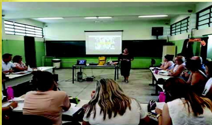
Capacitação aconteceu junto a todos os professores da Unidade