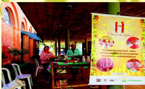
Cheiro do Mato em Exposição

em abril o Grupo participa do Mosaico dos Saberes no dia 28 e 29 com exposição de produtos e troca de conhecimento, no SESC.