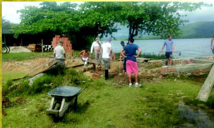
Mutirão no Píer Comunitário

A Comunidade do Marujá, com o apoio de representante da Câmara Municipal de Cananéia, realizou reformas na Escola Municipal de Ensino Infantil e Fundamental Marujá e no píer comunitário do bairro, com materiais doados pela Prefeitura Municipal de Cananéia. A comunidade se revezou entre a escola e o píer, realizando mutirões para garantir o bem-estar dos alunos e dos usuários do píer, enquanto os homens faziam o trabalho braçal, as mulheres se revezaram na cozinha para garantir o almoço dos trabalhadores.