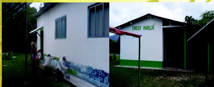
Antes e depois da Escola

A Comunidade fica, ainda, no aguardo da resposta do encaminhamento do Projeto de Sistema de Esgoto para o Marujá, que ficou a cargo da ECOS, que é a proponente do projeto junto à FEHIDRO - Fundo Estadual de Recursos Hídricos e Comitê de Bacias Hidrográficas do Vale do Ribeira.