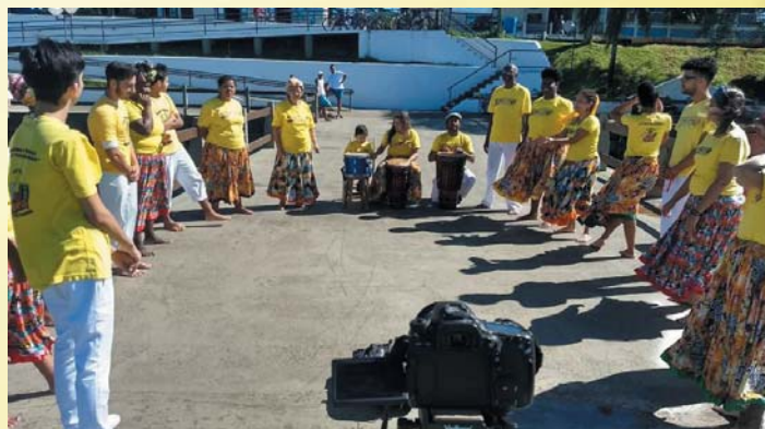
Gravação do Vídeo do Jongo