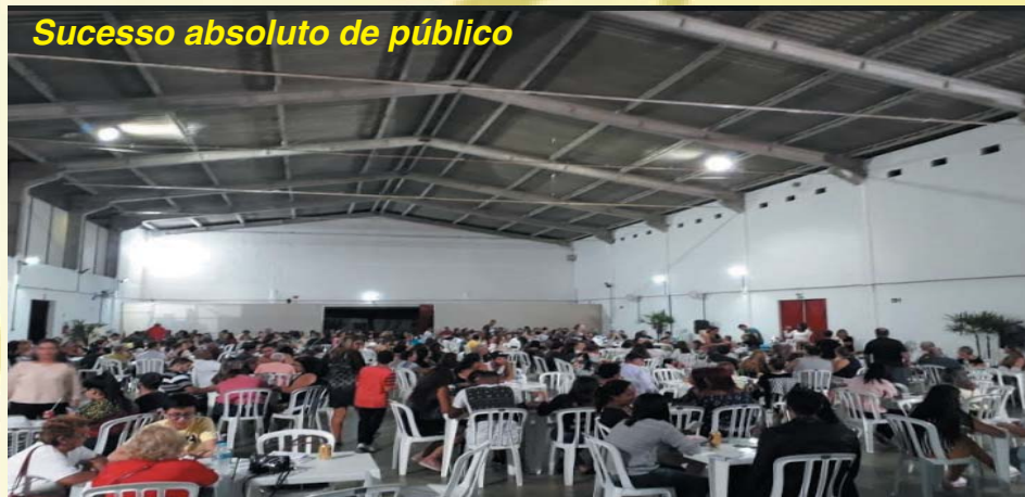
Sucesso absoluto de público

“Agradecemos a todos os comerciantes, amigos e voluntários que nos ajudaram e colaboraram para que esse sucesso fosse conseguido, nossa imensa gratidão”.