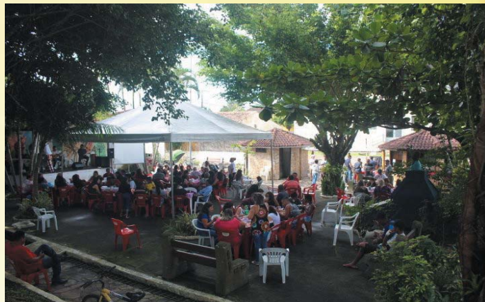
Feijoada da Iaiá

No último dia 19, sábado, munícipes e turistas puderam degustar da deliciosa Feijoada da Iaiá, que está em sua quarta edição. O evento ocorreu na Praça Theodolina Gomes – Tiduca, que desde a manhã de sábado começou a ser preparada para receber os interessados. Para animar quem optou por ficar na praça, a AGCTiduca trouxe a banda “É pra Sambar”, de Registro/SP, que fez o melhor do samba. Ao término da banda, integrantes da Comunidade Jongo Tiduca fizeram a tradicional Roda de Jongo mensal, levando aos presentes um pouco mais da rica cultura africana.