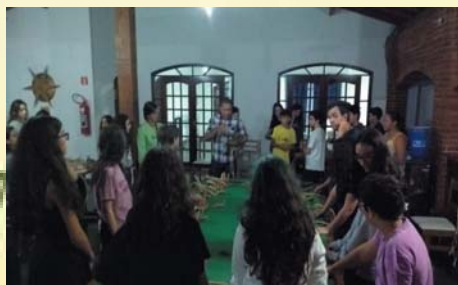
Oficina com jovens

CAMPANHA DE ARRECADAÇÃO DE PILHAS E BATERIAS USADAS: