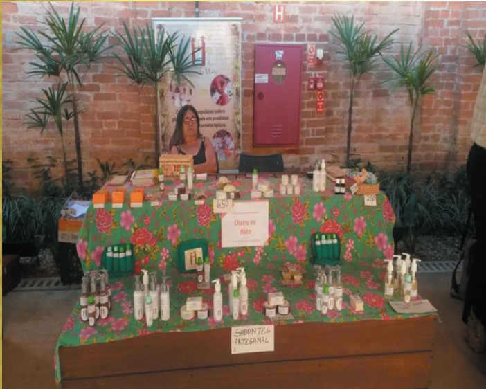
Participação no Mosaico dos Saberes no SESC

O Grupo Cheiro do Mato – Produtos Naturais com Plantas Medicinais do Itapitanguí busca ampliar a comercialização e divulgação dos produtos e uso das ervas medicinais, para isso participou no mês de abril do Mosaico dos Saberes no SESC – Serviço Social do Comércio de Registro, onde buscou, além de passar o conhecimento, aprender com outras experiências ligadas à agricultura no vale do Ribeira.