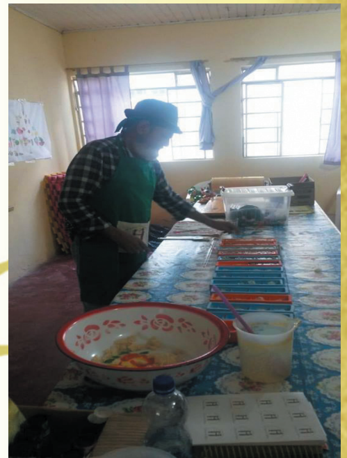
Oficinas no CRAS

As experiências trazem muito conhecimento para o Grupo e maiores expectativas para o trabalho, quando se replica os saberes tradicionais